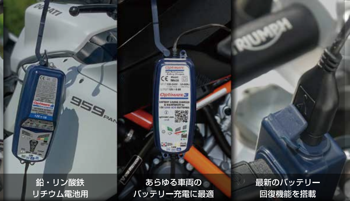
鉛・リン酸鉄 リチウム電池用