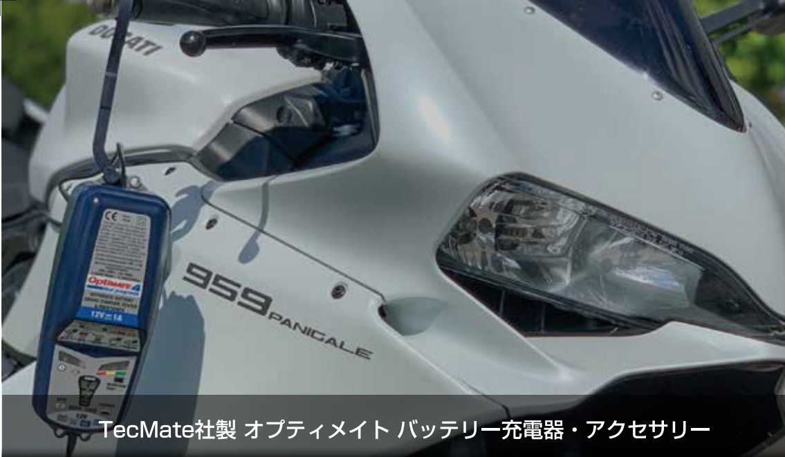
TecMate社製 オプティメイト バッテリー充電器・アクセサリ